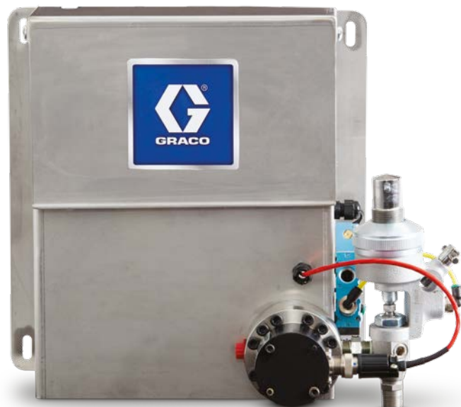
Панель оператора G3000 для подачи консистентной смазки

Вне зависимости от того, с каким количеством жидкостей вы работаете (их может быть от одной до восьми), система ProDispense позволяет полностью контролировать распределение каждой из них.