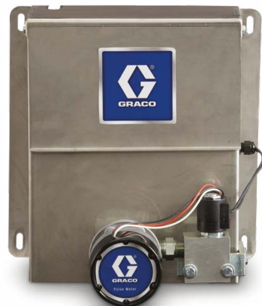
Панель оператора для подачи масла или воды